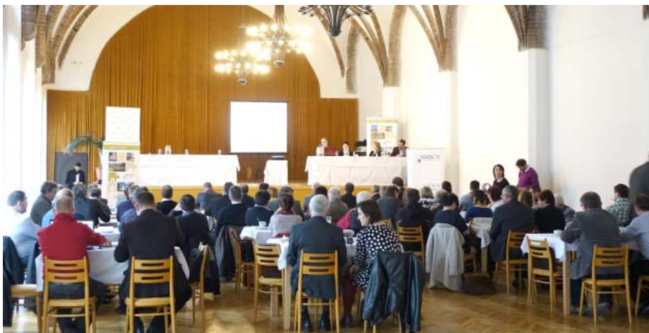
Velká dvorana Červeného zámku v Hradci nad Moravicí hostila 11. listopadu 2015 workshop Evropské fondy a MAS (podruhé) a polopatě, který byl součástí projektu

vy a samosprávy, koncepční návrh legislativních řešení meziobecní spolupráce na platformě MAS, zásobník dobré praxe: kuchařka ověřených nápadů z celé ČR a EU nazvaná Jak se vám líbí náš venkov? Strategie spolupráce obcí (SSO) na platformě Místní akční skupiny Opavsko z.s. a pakty o spolupráci a partnerství.