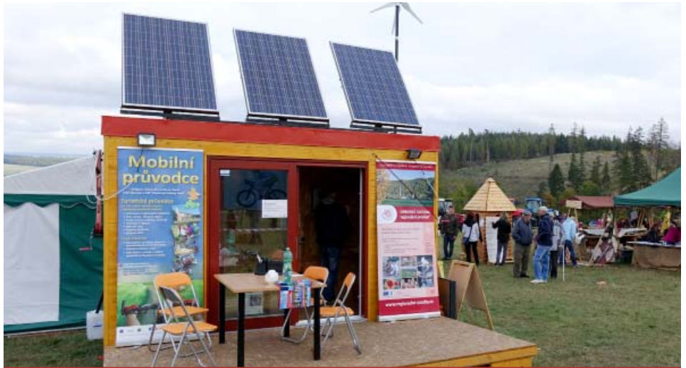
Mobilní výstava MAREK na Selské Hubertově jízdě v Mikolajicích

Překvapivě to nebylo nějaké ohrožení, které má rychlý průběh, ale byla to degradace půdy. Na téma degradace půdy odpovídali všichni nebo drtivá většina v pětibodové škále stupněm 5 nebo 4. Všechny trápí určitě riziko, že nebudeme schopni