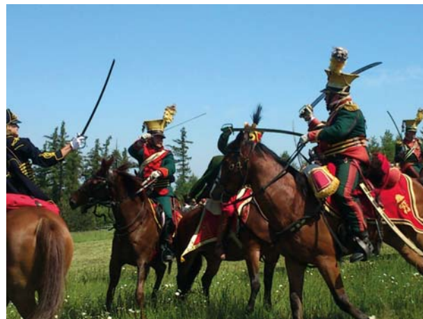
Oživlá historie Českého Slezska, květen 2012