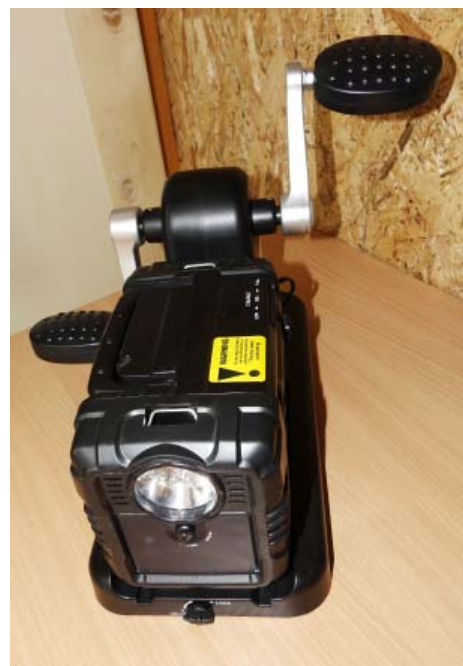
A opět vychytávka: Kdo šlape, dobije si mobil

Já jako stavař říkám, že je to pružná pevnost. Pevnost, která něčemu odolává,