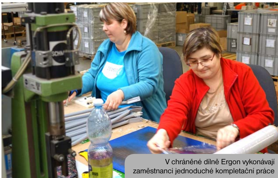
V chráněné dílně Ergon vykonávají zaměstnanci jednoduché kompletační práce

Řeší otázky zaměstnanosti, sociální soudržnosti a místního rozvoje a svou činností podporuje solidární chování, sociální začleňování a růst sociálního kapitálu zejména na místní úrovni s maximálním respektováním trvale udržitelného rozvoje. (Strategie regionálního rozvoje ČR 2014-2020)