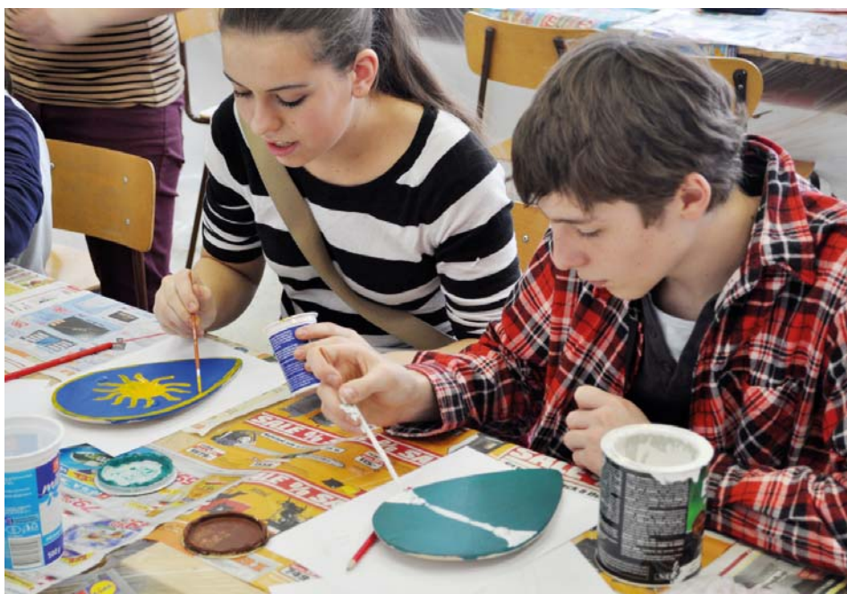
Dějepis trochu jinak - v rámci projektu Doubravka a Měšek - 1000 let společné česko-polské historie si děti ze základních škol vyzkoušely výrobu historických rekvizit a kostýmů.

Podrobnější informace budou postupně k dispozici na webových stránkách MAS Opavsko www.masopavsko.cz/map/