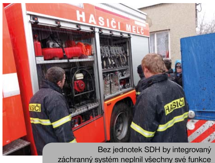
Bez jednotek SDH by integrovaný záchranný systém neplnil všechny své funkce

Obecní vybavenost – na příkladu knihoven propojených do sítí s možností vypůjčit si jakoukoliv knihu s dodáním až do místní pobočky lze ukázat, jaké možnosti nabízí propojení tradiční instituce s moderní technologií. Jiným příkladem je využití kulturních domů jako živých komunitních center se senior kluby, se sdíleným vybavením, komunitními kuchyněmi, klubovny apod. Dokonce i řada televizních stanic již dnes funguje na regionálním decentralizovaném principu.