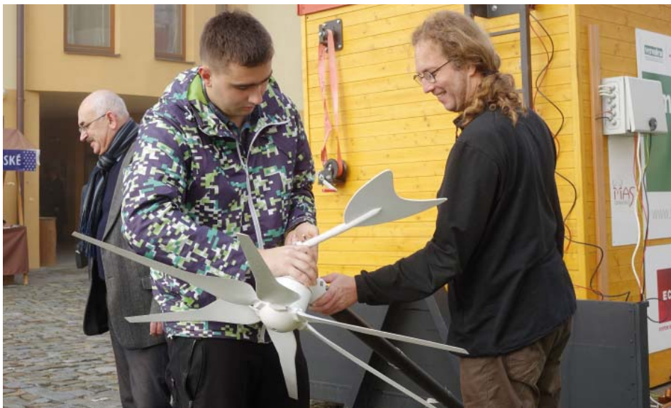
Montáž malé větrné elektrárny o výkonu až 300W.

To ani není jeho smyslem. Není v našich silách, aby si najednou všech 52 obcí naší masky, nebo obce dalších místních akčních skupin po celé republice najednou dovybavily kanceláře. Úlohou místní akční skupiny je přinášet právě takovéto pilotní ukázky. Pokud několik stovek starostů v celé republice vidělo, jak se dá jednoduše udělat zásobování kanceláře náhradním zdrojem energie, tak kdyby pár desítek z nich to realizovalo a pak to řeklo dalším, tak jsme rozpoutali něco, čehož důsledkem může za pár let být, že se tato společnost stane resilientnější. Pokud v obci budou dvě, tři budovy (obecní úřad,