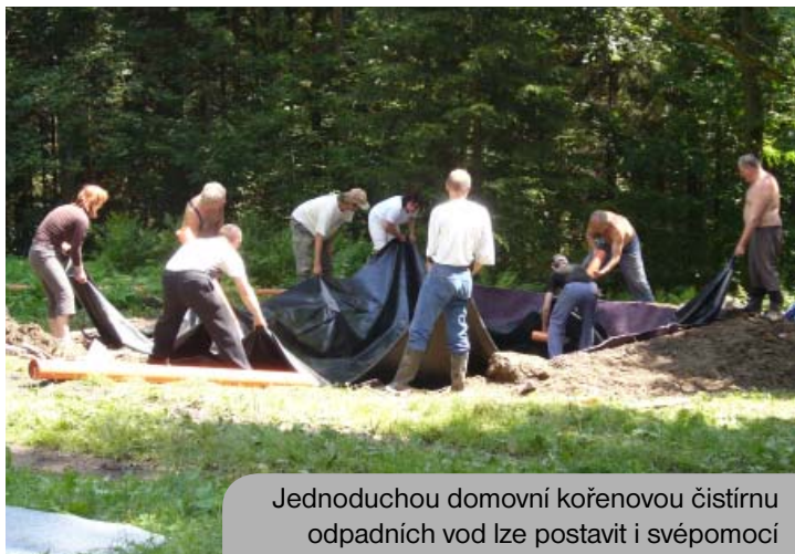
Jednoduchou domovní kořenovou čistírnu odpadních vod lze postavit i svépomocí

Vzdělávání dospělých - témata podle potřeb a zájmu občanů, také podle specifických zájmů a potřeb obce, ve známém prostředí ve společnosti známých a sousedů, propojení dospělých s dětmi ve společném zájmu o vzdělání a informace. Opět využití školních budov a zařízení i mimo běžnou školní výuku, zvláště při poklesu počtu dětí. Místní ekonomika a podnikání – malé a střední podniky, malá vědeckovýzkumná centra, propojená informační sítí navzájem i s velkými (i nadnárodními) firmami nemusí být vázány na centrální strategické zóny, ale mohou využívat stávající objekty, plochy, infrastrukturu i dostatek motivované pracovní síly na venkově. Místní pracovní místa jsou stabilní, stejně jako daňové výnosy pro místní veřejné rozpočty, malé firmy neodcházejí do daňových a legislativních rájů. Pro zaměstnance je důležitá časová úspora v dojíždění do zaměstnání, pro celou obec je výhodná hmotná i finanční podpora obecního a spolkového života, kapacita podniků v technice, vybavení i lidech je zásadní pro zvládání krizí a katastrof. Pro rozvoj decentralizované ekonomiky by bylo vhodné dát obcím do ruky více nástrojů, včetně daňových.