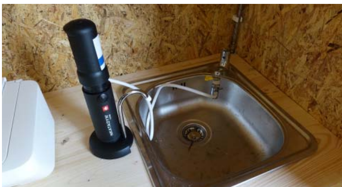
Nezbytností je filtrační pumpa

Po krátké době bylo znát, že je tam určitá pravidelnost a nějaký vzorec nastavený podle přírodních podmínek. Týká se to třeba ohrožení větrem. Tam samozřejmě patří horské oblasti, na návětrných místech jsou ohroženy víc než oblasti v podhůří, v takové mírné pahorkatině. Zdejší lidé si někdy ani nepamatovali, jak se u nich projevil ty známé epizody jako orkány Kyrill a další.