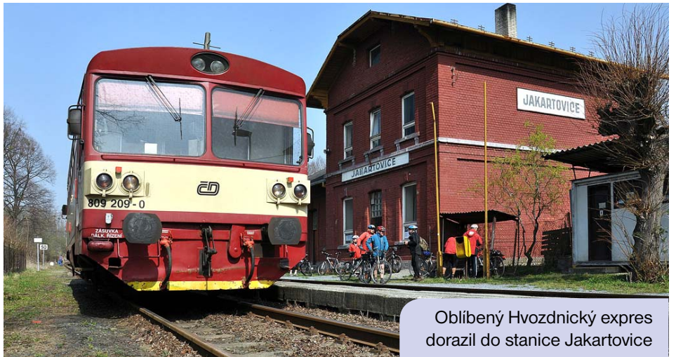
Oblíbený Hvozdnický expres dorazil do stanice Jakartovice

Členy Místní akční skupiny Opavsko jsou také mikroregiony. Na našem území se najdeme celkem čtyři. Mikroregion Hvozdnice, Mikroregion Opavsko severozápad, Mikroregion Matice Slezská a Venkovský mikroregion Moravice. Představitelé jednotlivých mikroregionů se s námi podělili o několik postřehů ze života v mikroregionech.