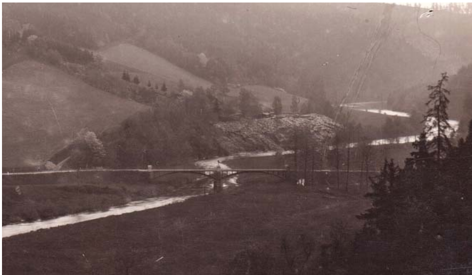
Odstranění náletových dřevin a drobných úprav se dočká také záluženský Rotterův lom (na fotografii v době mezi 1. a 2. světovou válkou). Bylo a je to prokazatelně první místo dolování břidlice v Zálužném, kde se těžilo již před r. 1820

cované nominační dokumentace Radě národních geoparků, k jejímuž částečnému zafinancování projekt přispěje.