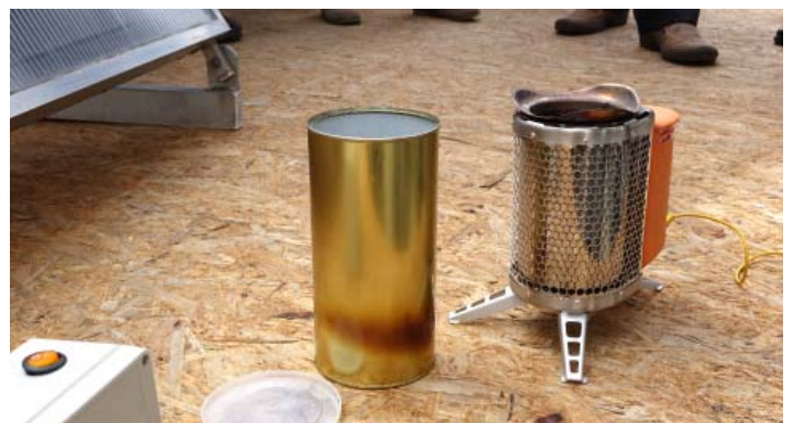
K vybavení kontejneru patří zařízení BioLite, jakási USB tepelná elektrárna