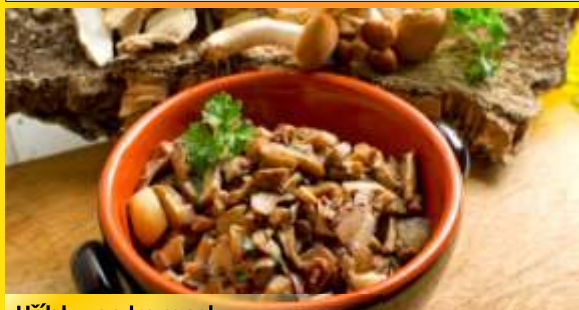
Hříbky po tramsku

Maso jemně umeleme spolu s okurkou, přidáme nasekanou cibuli s feferonkou. Okořeníme dle chuti a mažeme na opečené topinky, pořízené česnekem.