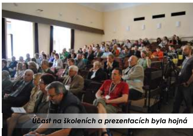
Účast na školeních a prezentacích byla hojná

LeaderFEST 2011 skončil, ale program LEADER je tady stále a proto věříme, že využijeme aktivně následující roky, aby mohl dále vzkvétat nejen náš region.