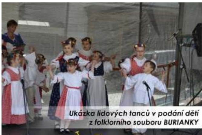
Ukázka lidových tanců v podání dětí z folklorního souboru BURIANKY

Program začal již 16.5.2011 večer na neformálním setkání u Štramberské trúby, kde hrála cimbálová muzika a všichni se vzájemně poznávali.