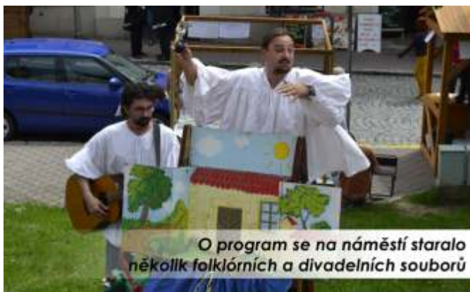
O program se na náměstí staralo několik folklorních a divadelních souborů