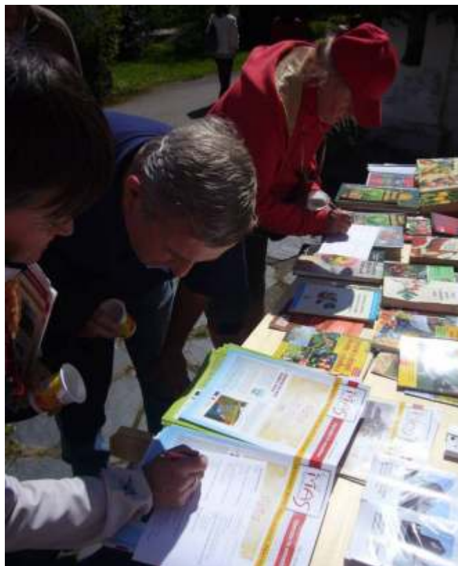
Luštění kvízu v Arboretu Nový Dvůr

Ani ovocnářský kvíz neunikl vašemu zájmu. Odvážných soutěžících bylo sice méně než v loňském ročníku, ovšem dosahovali výrazně lepších výsledků. Do slosování jsme zařadili všechny vyplněné tikety, které neměly více než 3 chyby, tedy téměř všechny. Správné odpovědi na soutěžní otázky kvízu najdete na www.ovocne-stezky.cz . Na těchto stránkách jsou neustále doplňovány nejrůznější ovocnářské návody, články a recepty a řada dalších informací o aktuálním dění. Podělit se o své ovocnářské či kulinářské zkušenosti můžete i vy. Pošlete nám své rady, návody a tipy: co, jak a kdy na zahradě či v sadu děláte, jak pečujete o své ovocné stromy, jak zpracováváte ovoce a hlavně nám zasílejte recepty na ty největší ovocné dobroty.