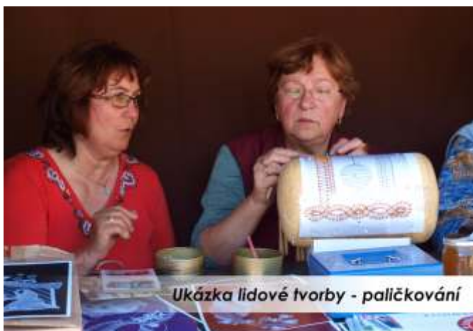
Ukázka lidové tvorby - paličkování