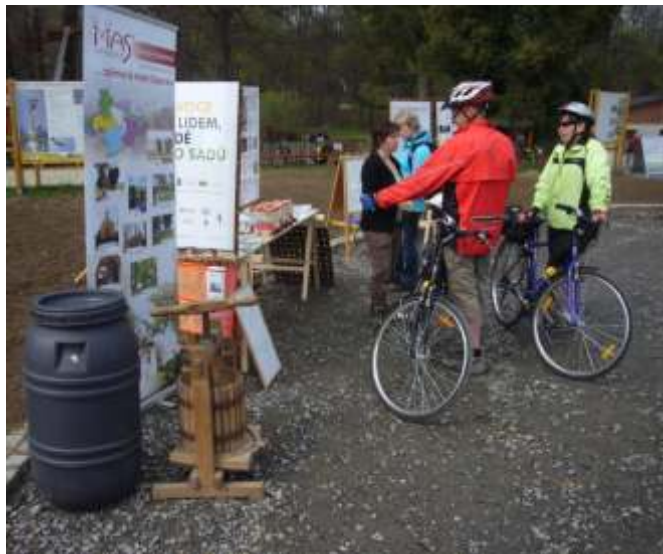
Také cykloturisty zaujal ovocný stánek Davidův mlýn ve Starých Těchanovicích

A co se dělo na stánku letos? Opět jste se mohli ptát na různé ovocnářské problémy, diskutovat, prohlédnout si ukázky odborné literatury, ochutnat mošty nebo ovocné dobroty. Jelikož zjara nejsou k dispozici vhodná jablka, byla soutěž o nejdelší jablečnou slupku nahrazena roubovacím trenažerem. Roubování není obecně rozšířená dovednost, ale těší nás váš zájem se něco naučit a jsme rádi, že se při nácviku roubování nikdo nezranil.