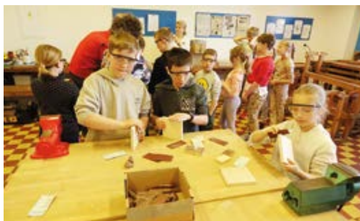
ZŠ Komárov v Raduni.