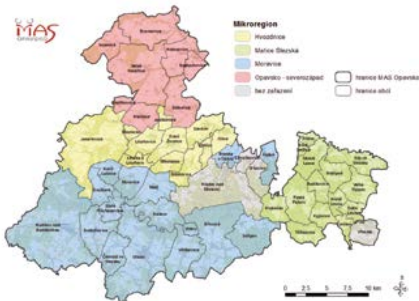
Obce a území působnosti Místní akční skupiny Opavsko z.s.