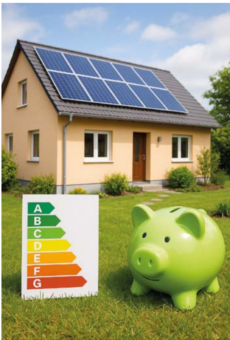
Ilustrační foto vygenerované AI.

Od začátku roku 2023 do konce roku 2024 podala Místní akční skupina Opavsko celkem 845 žádostí v rámci programu Nová zelená úsporám Light (NZÚL), který je zaměřen na podporu nízkopříjmových domácností. Celková hodnota těchto žádostí činí 110 536 738 Kč. Jedná se o významný příspěvek ke zlepšení energetické efektivity domácností v regionu a ke snížení jejich provozních nákladů.