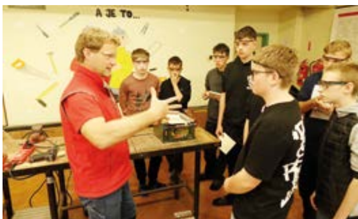
ZŠ Mladecko.

Program je určen nejen dětem, ale také pedagogům, rodičům, prarodičům – všem, kteří mají zájem společně tvořit, zkoumat a objevovat technický svět hravou formou. Díky mobilnímu charakteru laboratoře mohou tyto aktivity probíhat přímo v místních komunitách, čímž se zajišťuje dostupnost a inkluze i v menších obcích. MAS Opavsko tak aktivně přispívá k podpoře polytechnického vzdělávání a mezigeneračního učení v regionu.