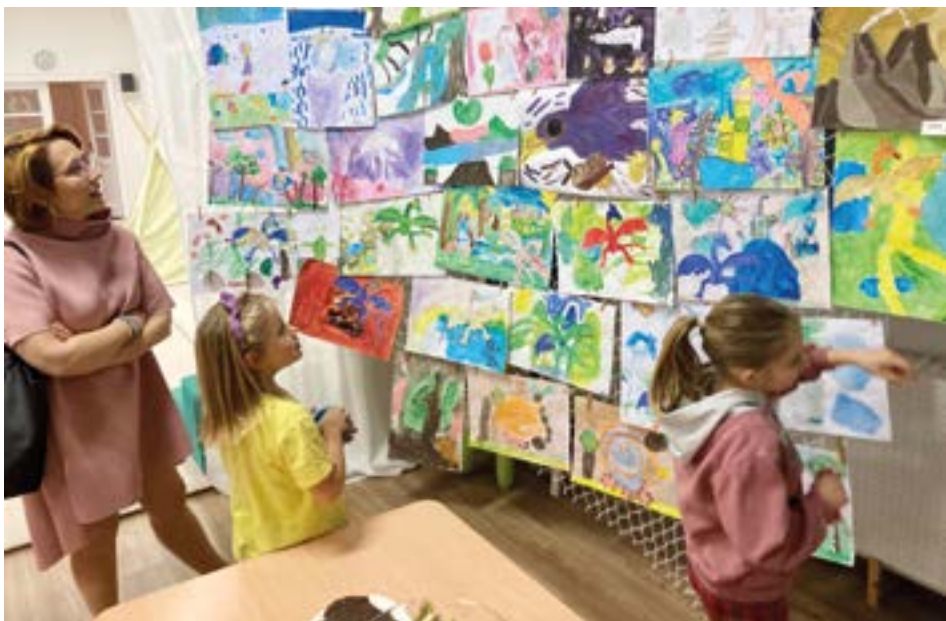
Alma Mater - okénko ARTE tvořivosti ve výtvarné a keramické dílně.

Chcete podpořit spolkový život na Opavsku? Pomocí vašich darů může Malý LEADER nechat rozkvést činnost spolků a bude to vidět.