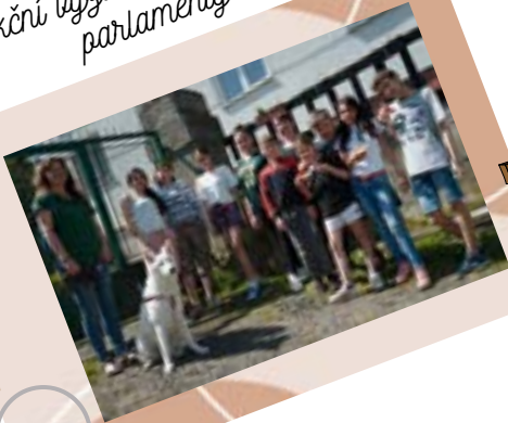
Akční výzva pro žákovské parlamenty