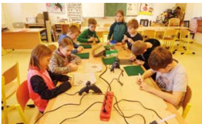
ZŠ Komárov v Raduni.