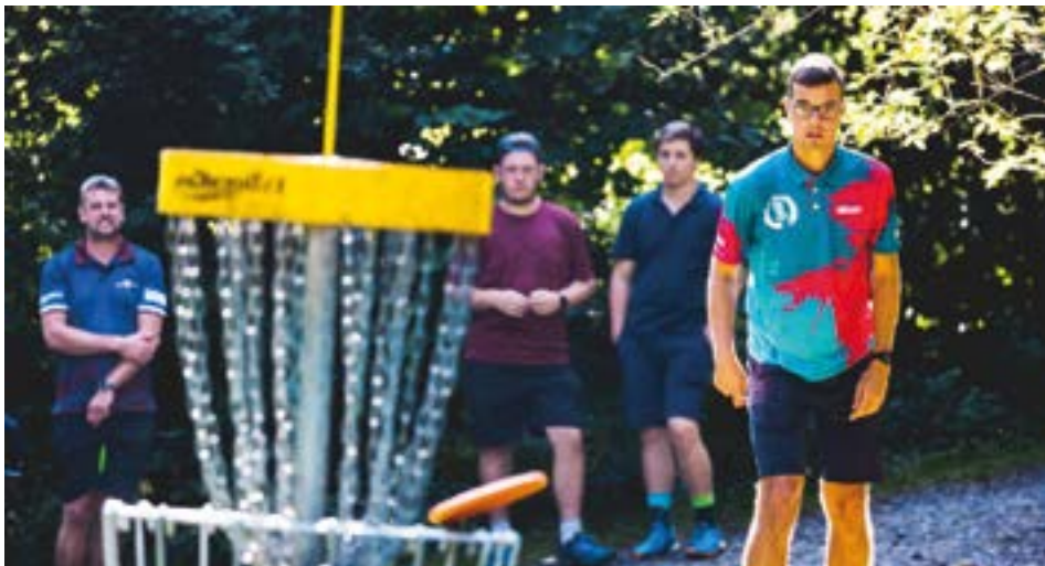
DGC Flying Dragons BnB z.s. - Budišovská břídla.