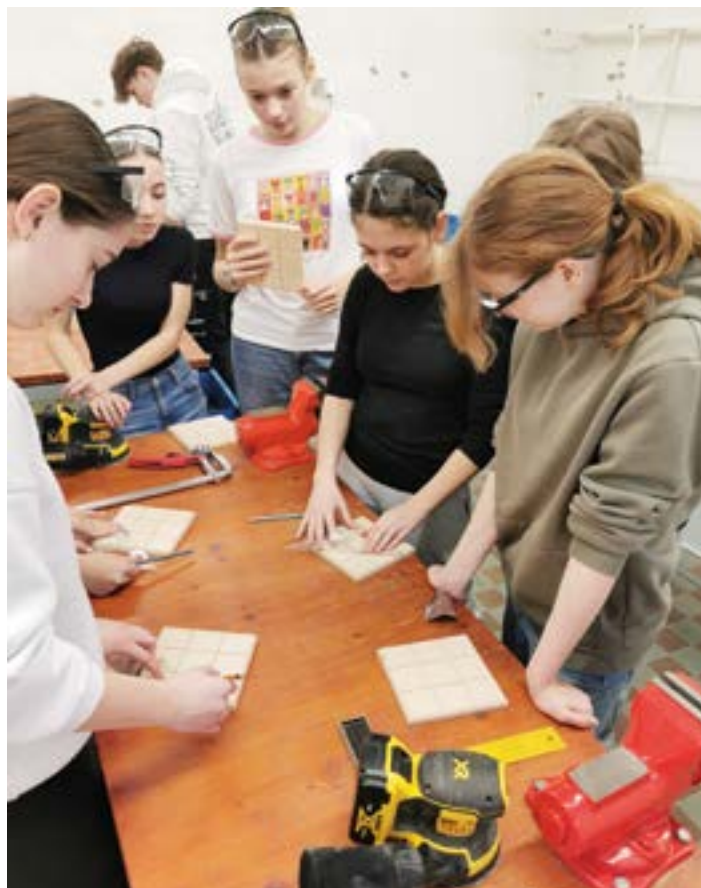
ZŠ Ilji Hurníka.