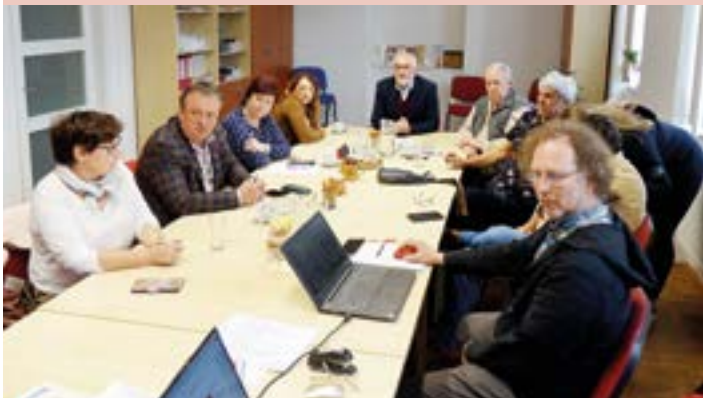
Výbor MAS Opavsko.

Při rozvoji venkova spolupracujeme s řadou organizací. Hledáme a nalézáme partnery pro témata jako je podnikání, životní prostředí, zemědělství, péče o krajinu, vzdělávání, spolkový život, kultura a rozvoj venkovských tradic.