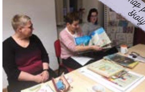
Setkávání výchovných poradců