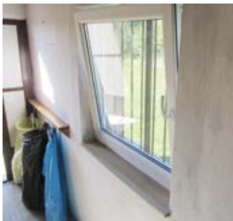
ZO ČZS Budišov nad Budišovkou - Materiál na výměnu 5 ks plastových oken.